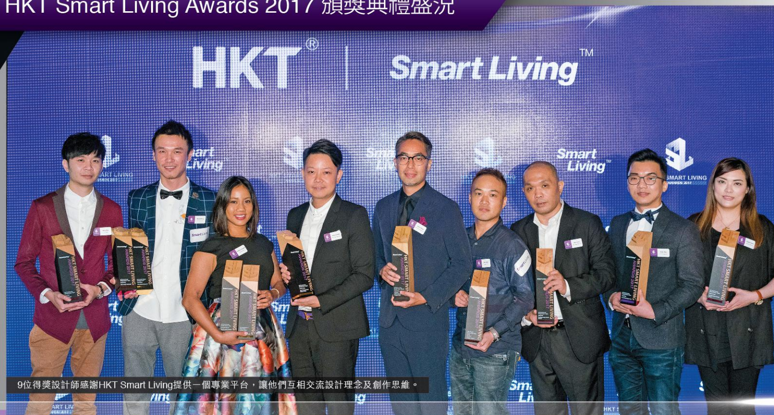
9位得獎設計師感謝HKT Smart Living提供一個專業平台，讓他們互相交流設計理念及創作思維。